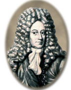
Ole Christensen Roemer (1644-1710)

(1) وحدة القوى والمواد في الأصل والطبيعة والحركة العاجلة: